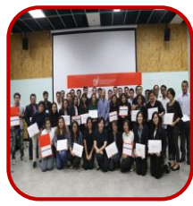
จัดร่วมกับศูนย์ (REDEX) มจร.