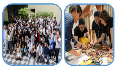
จัดร่วมกับศูนย์ IDE มหาวิทยาลัยหอการค้าไทย